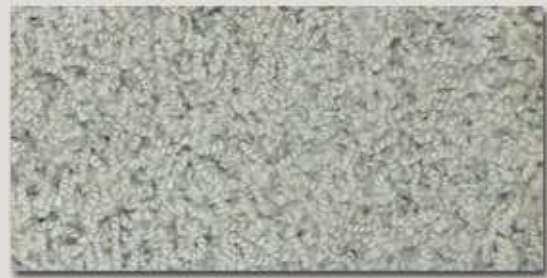
Chorus MO ..... Seite 7+8