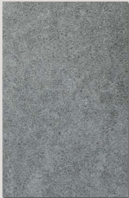
Concrea MO ..... Seite 17