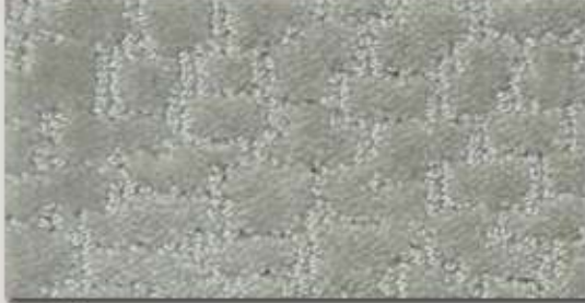
Cut MO ..... Seite 13+14