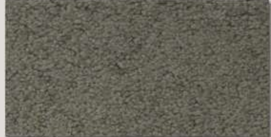
Cresta MO ..... Seite 11+12