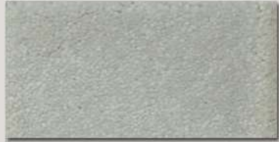
Chill MO ..... Seite 3+4