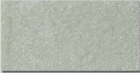
Couture MO ..... Seite 9+10