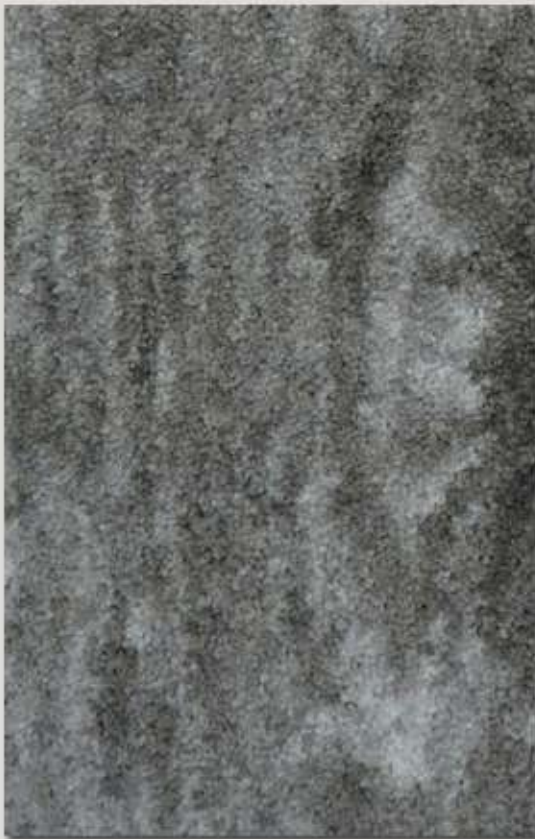
Cortex MO ..... Seite 15+16