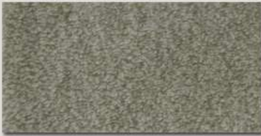
Charme MO ..... Seite 5+6